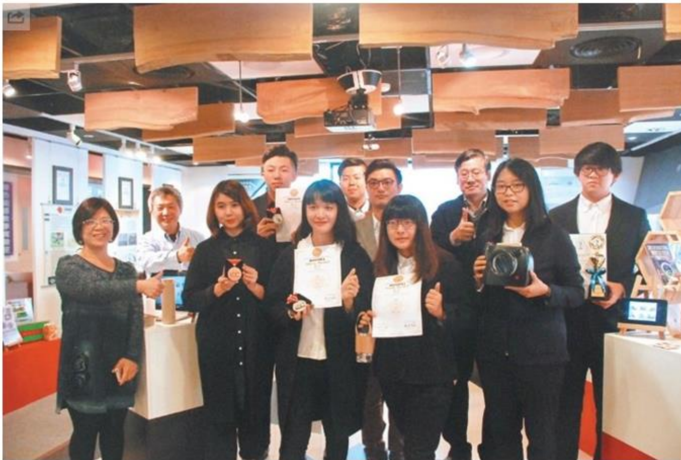
中華大學在國際發明舞台上大創佳績，去年拿下世界八個國家的國際發明展。

在提升就業競爭力方面，本校推動「職場爭霸-就業力養成」分流培育計畫，以提高畢業生初次受雇之薪資水準。此外，本校成立創新創業中心與衍生事業投資基金，鼓勵有志者在畢業時成功創立新事業，形成畢業生就業與創業之分流。